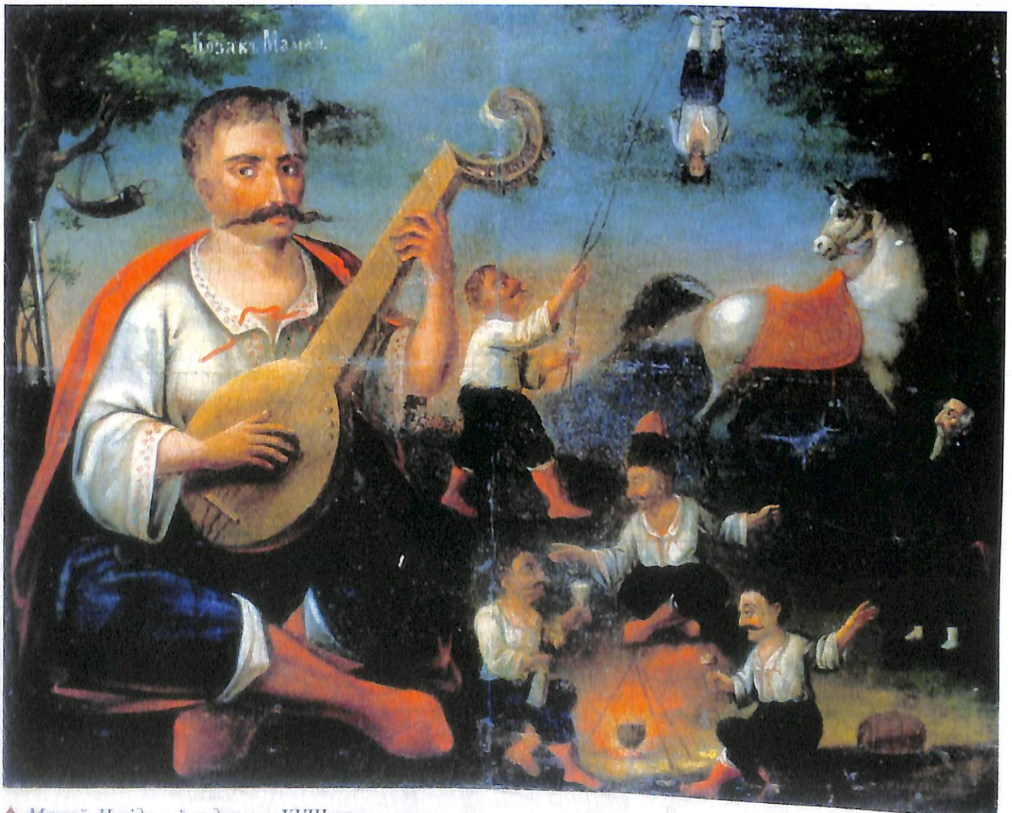
▲ Мамай. Невідомий художник XVIII ст.

джерел про козаків, які «много лиха чинять» підданним кримського хана стають регулярними. Король і великий князь Зигмунд I Старий, отримуючи численні повідомлення про успішні дії козацьких загонів і ватаг проти татар і турок, в 1524 році розробляє плани оселення за державний кошт кількох тисяч козаків на островах у пониззі Дніпра, оскільки від них «була б велика і знаменита послуга і оборона державам нашим (тобто – Литві і Польщі)». А вже на середину XVI ст. звичай «козакувати» у перепов-